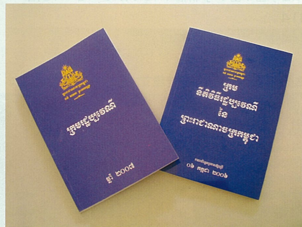
カンボジアの民法典・民事訴訟法典

2008年4月からは新たなフェーズが展開されています。「法制度整備（フェーズ3）」（2008年4月～2012年3月）では、フェーズ2に引き続き、民法・民事訴訟法関連法令の起草・立法化支援や普及活動が行われていますが、カンボジア側が徐々に自立できるようになることを目指し、司法省の体制作りも支援しています。また、「裁判官・検察官養成校民事教育改善プロジェクト（フェーズ2）」（2008年4月～2012年3月）では、裁判官・検察官養成校の自立発展性を高めることを目指し、引き続き教材作成や教官候補生の養成を支援しており、プロジェクト終了時には、日本が支援した新しい民事分野のカリキュラムで教育を受けた卒業生は220名になる見込みです。