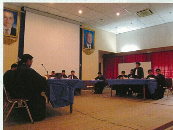
カンボジアでの模擬裁判風景（2007年12月）