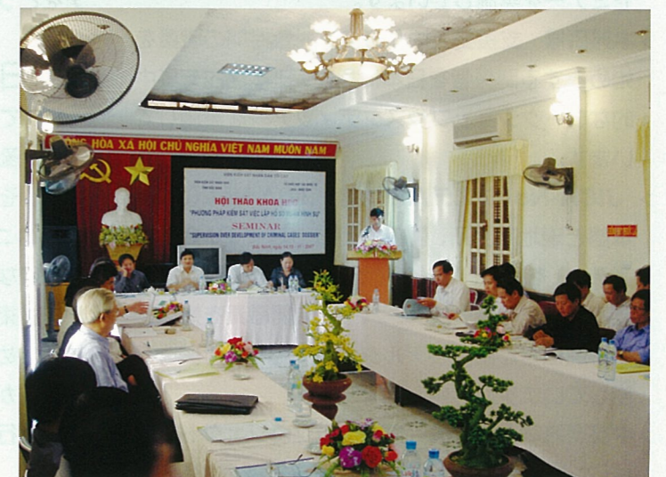
国家賠償法に関するワークショップ（2008年8月）

JICAの法整備支援についてまとめた報告書「法の支配の実現を目指して ～JICAの法整備支援の特色～」の全文は、JICA図書館ホームページにて、今年度に公開予定。