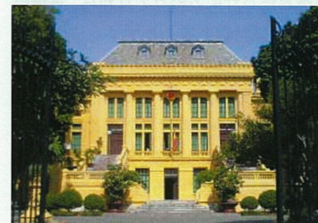
ベトナム最高人民裁判所

現在実施している法・司法制度改革支援プロジェクト（2007年4月～2011年3月）では、中央レベルのみを対象とした支援では地方レベルに改善の結果が浸透しないというフェーズ3までの教訓を活かし、中央レベルのみならず地方レベルの課題の解決への取組みも行なっています。パイロット地区を設置し、同地区における裁判等の実務から得られた教訓と考え方を、中央機関にフィードバックし、ルール・組織の整備及び法曹人材育成に反映することにより、更なる実務改善に取り組んでいます。